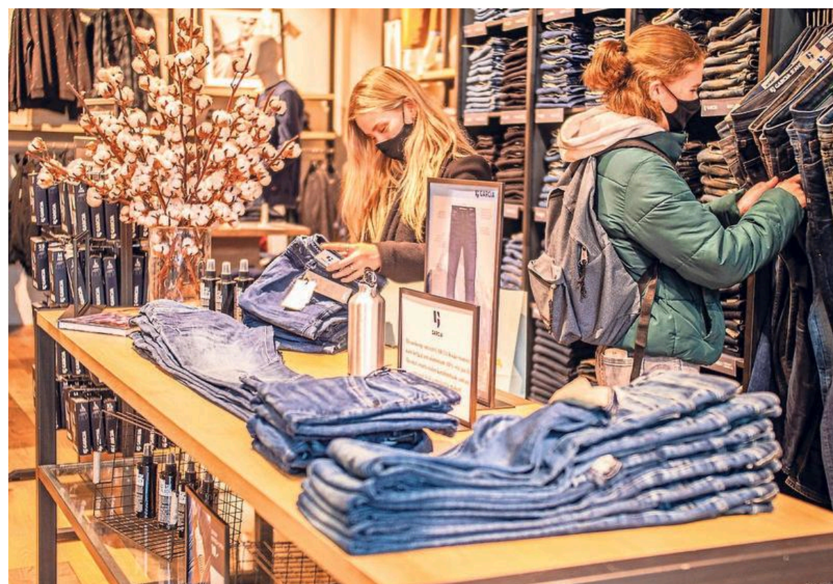
Het Jeans Centre in Schagen. Hier wordt ook een organische collectie aangeboden.

Vanilia-zaken stralen klasse uit, zo ook het filiaal in Hoorn. Mana-