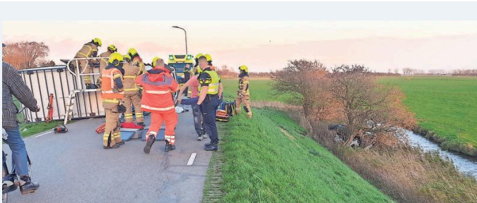
De tractor belandde onder aan de dijk, rechts.