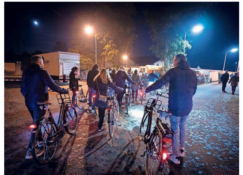
Op de fiets naar de optredens.

„Stiekem zijn we al aan het oriënteren voor de optredens van volgend jaar