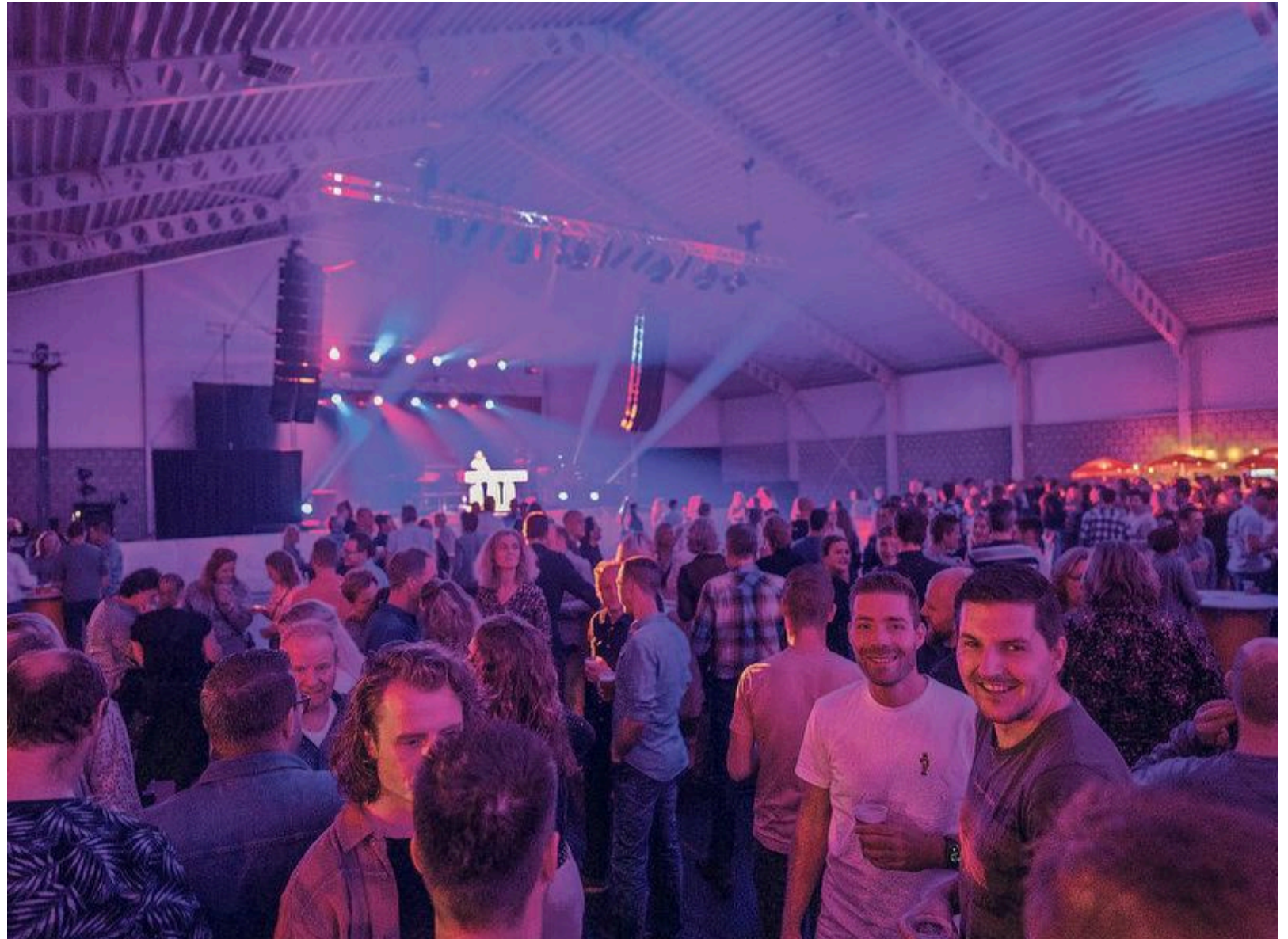
Drukte tijdens de eerste editie van Koggepop Live: op de vrijdag stonden de Hollandse meezingers op het programma.

Dat de organisatie niet aan half werk doet, is te zien. Een goede lineup aan artiesten, foodtrucks buiten, een gezellige toiletjuffrouw, de sporthal omgetoverd tot een feesttent en wat natuurlijk niet kan ontbreken zijn alle feestvierders. Alle elementen voor een mooie avond zijn aanwezig.