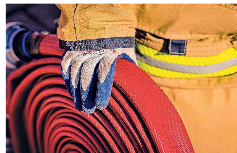
De blusslangen gedragen naar de plek waar ze nodig zijn.

„Met terugwerkende kracht hadden we punten uit dit traject naar efficiëntere, meer gebiedsgebonden brandweerzorg anders moeten