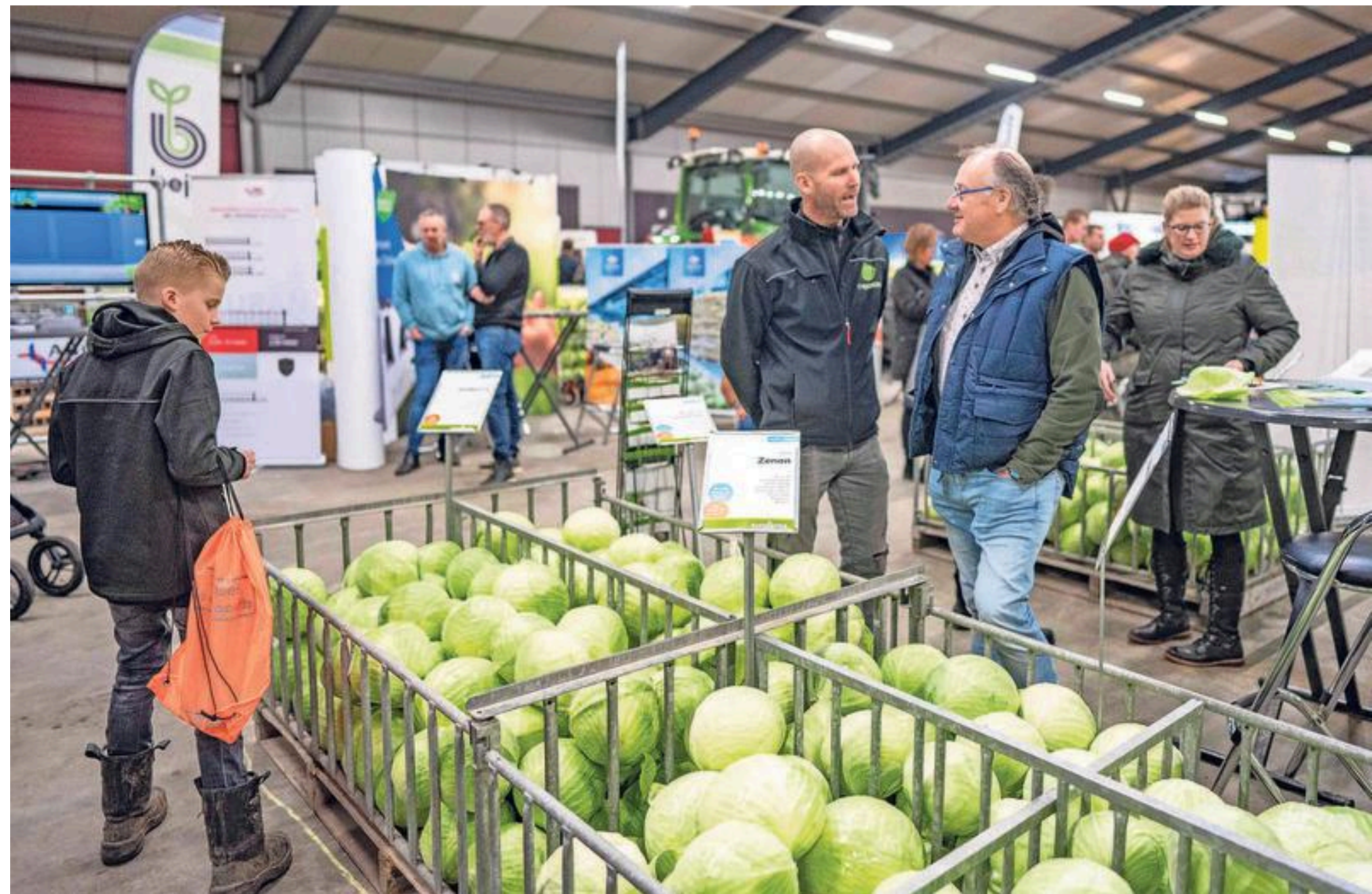
De RoDeKo, zien en gezien worden in een decor van kool..