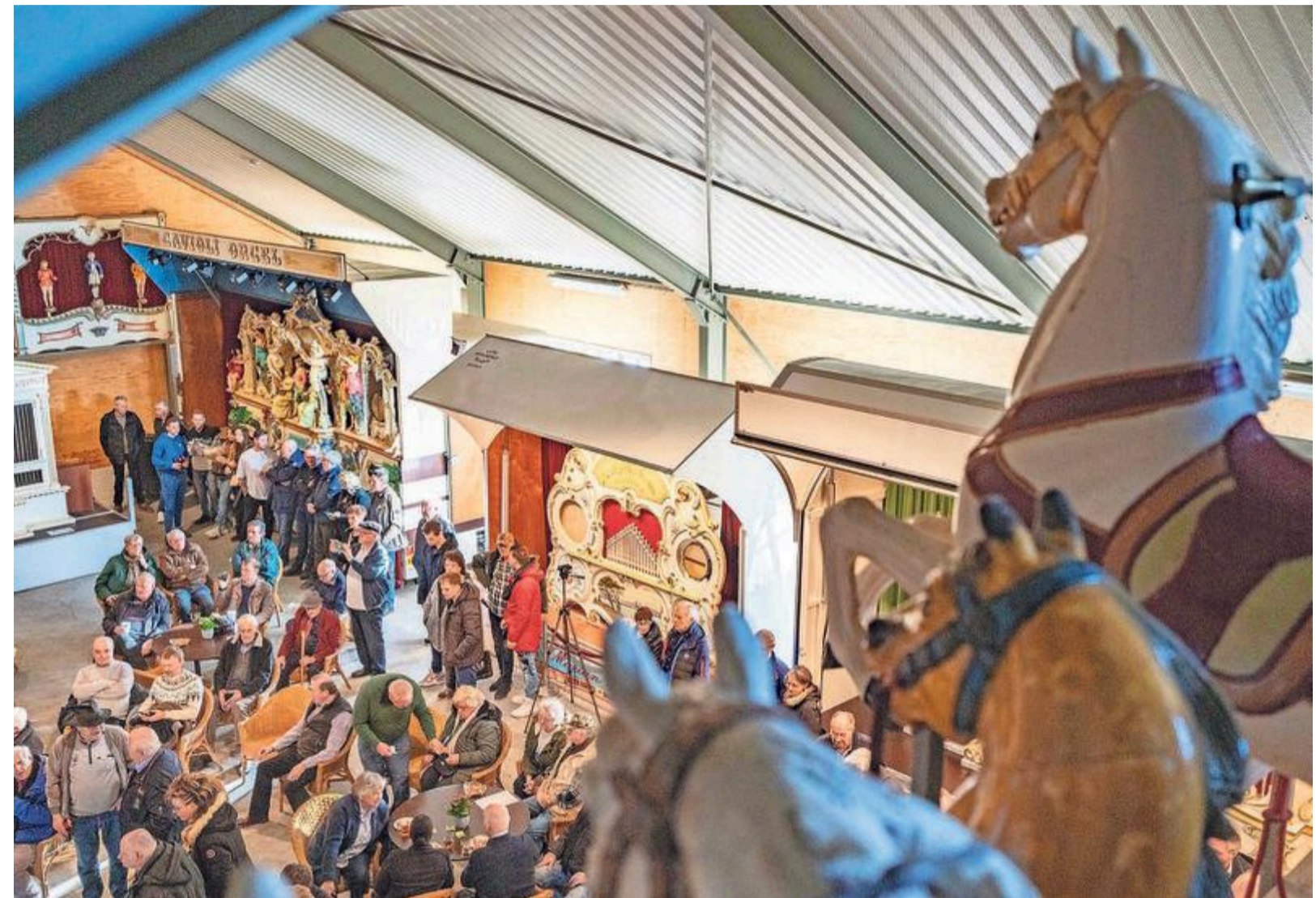
Drukte op de zestiende kermisorgelshow van de familie Vader.

Vader vertelt over de restauratie van een van zijn orgels. „We hebben deze week nog een orgel afgemaakt. Het lijkt op een tempel met zuilen. Hier waren we ongeveer vijf jaar