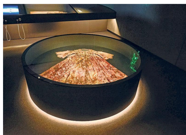
Eén van de topstukken in de collectie van Museum Kaap Skil is een zeventiende eeuwse jurk van koninklijke allure, opgedoken uit de Waddenzee.

Het afgelopen jaar kwam daar verandering in. De bezoekersaantallen stegen en veel musea zitten bijna