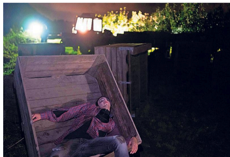
Zombies uit The Walking Dead.

„ Wij houden hier wel van, ons huis hangt vol met Halloween-decoratie