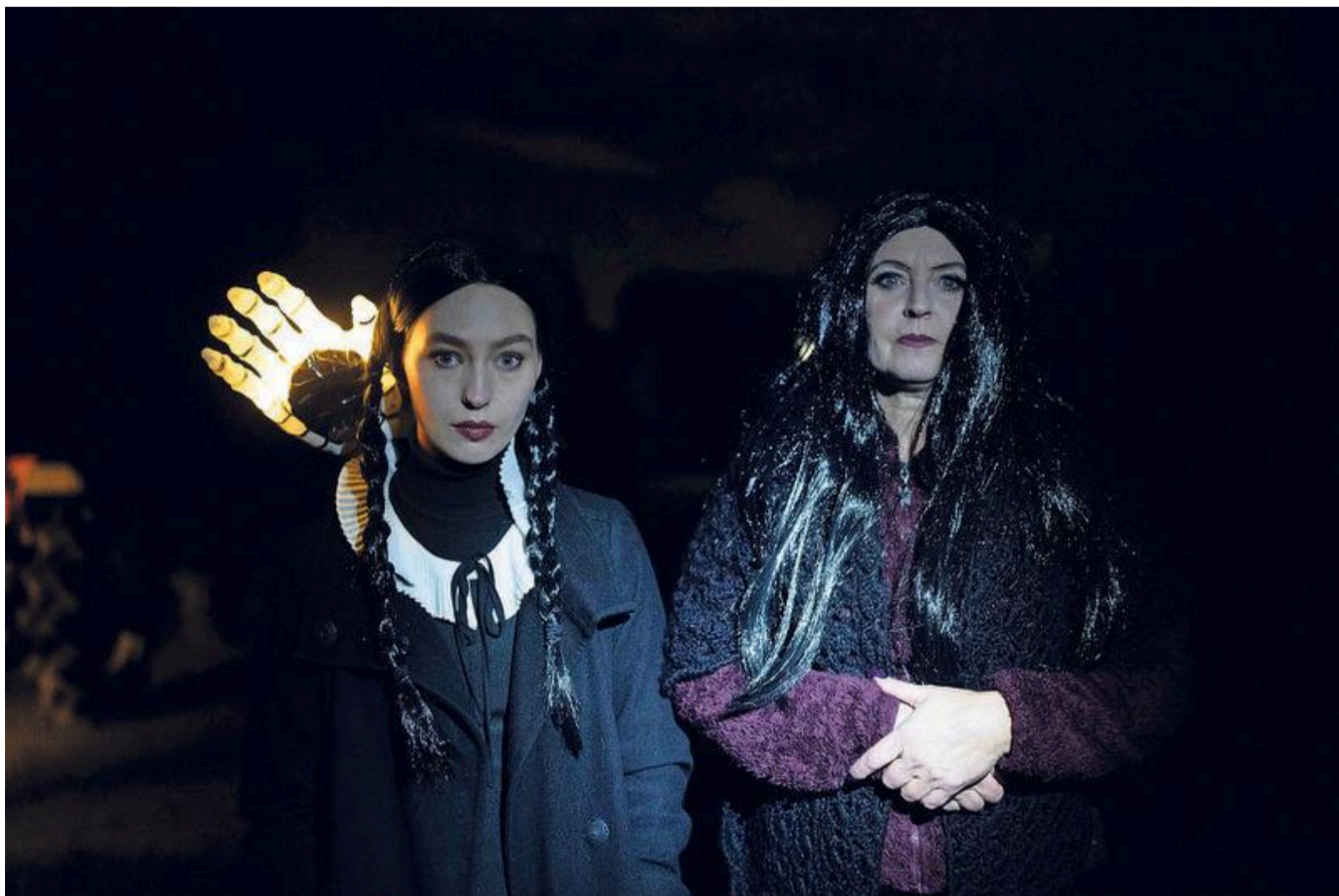
Wednesday en Morticia Addams begroeten je aan het begin van de spooktocht.