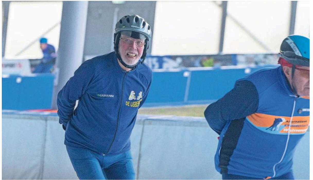
„Schaatsen geeft een fantastisch gevoel.”