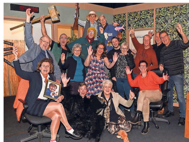
Lely uit Slootdorp speelt in de Langewegkerk.

„We zijn in slaap gesukkeld en tot op heden nog niet wakker geworden