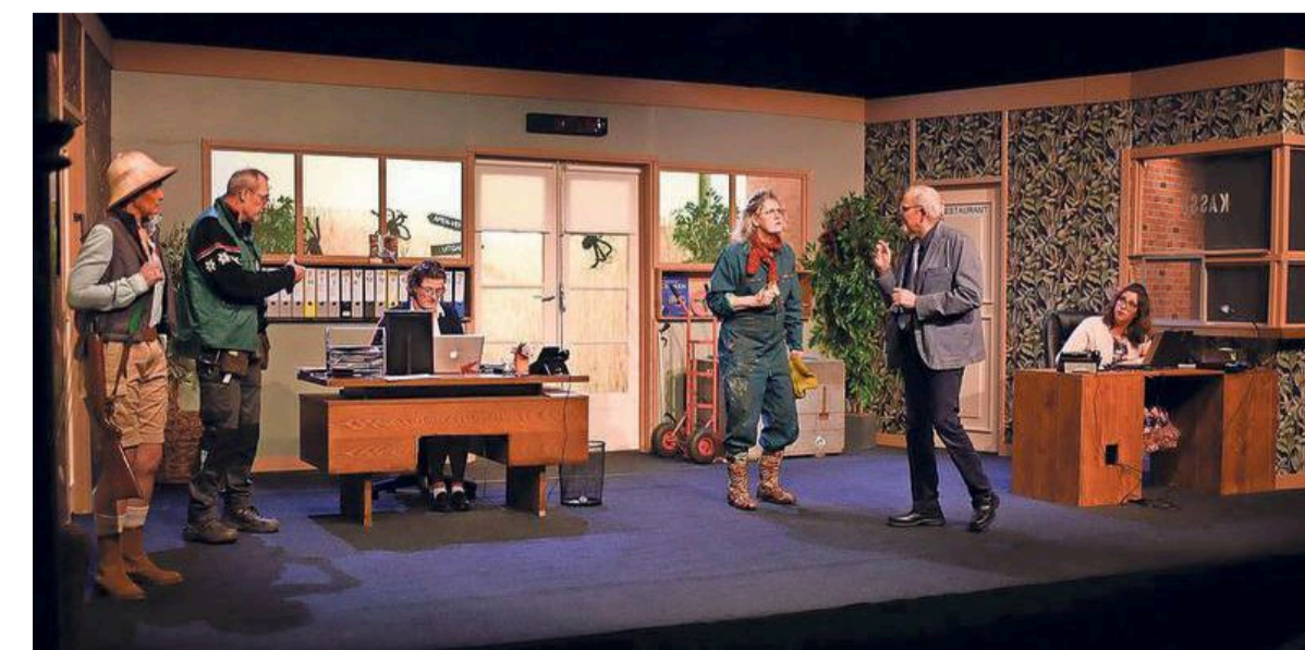
Alle vijf voorstellingen in Slootdorp waren uitverkocht.

„Verenigingen hebben in Noord-Holland een belangrijke functie binnen het dorp