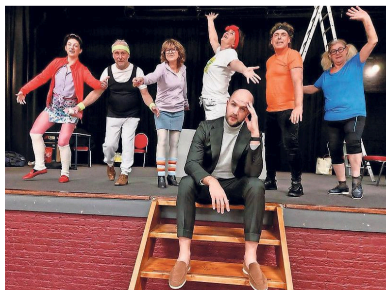
VVO Dirkshorn speelt in april de voorstelling 'Amateurs!'

„Als vereniging ben je altijd weer blij als je een regisseur hebt gevonden