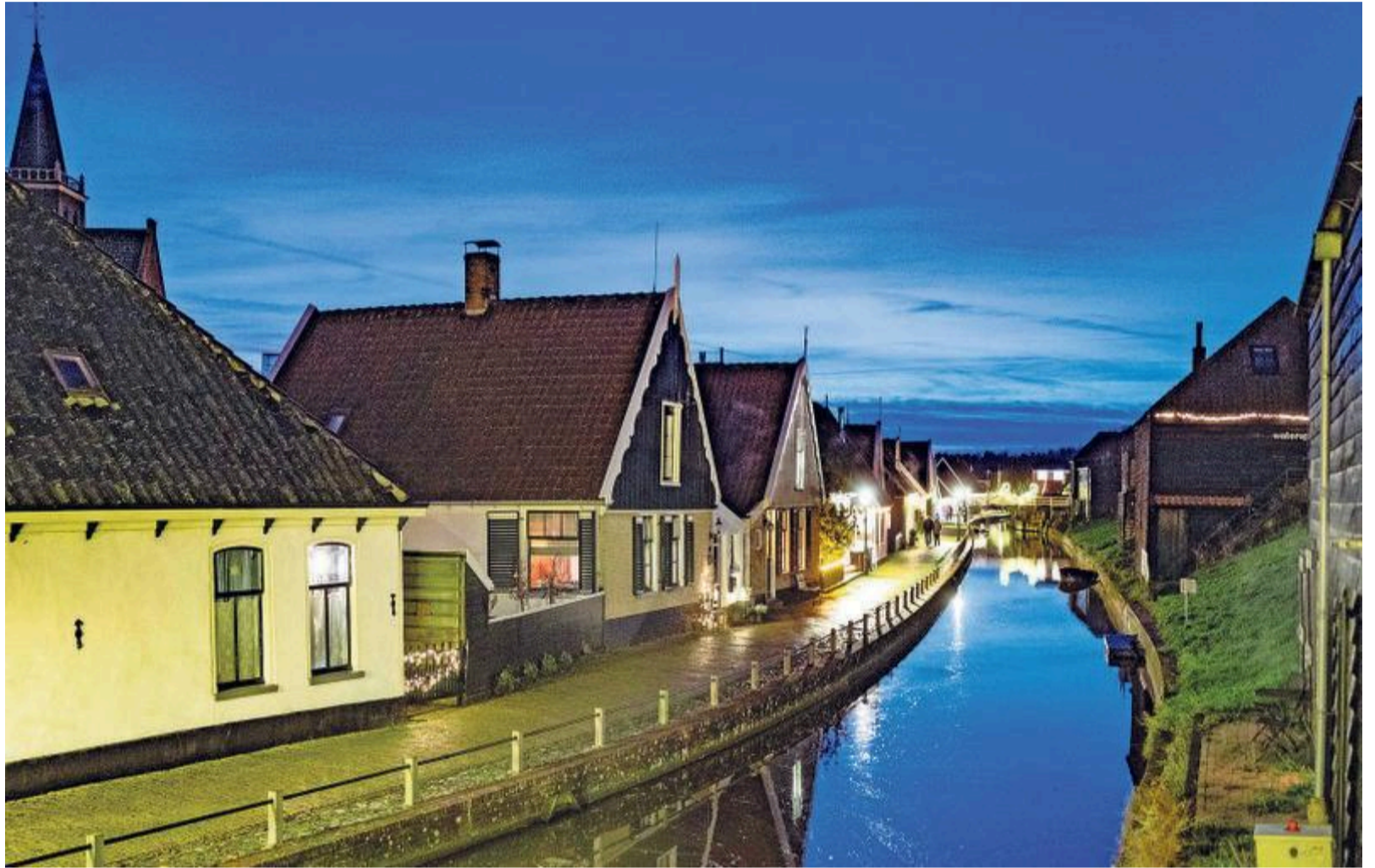
Kolhorn is sfeervol verlicht.