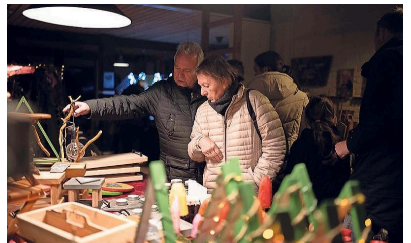
Struinen tussen kerstspulletjes.