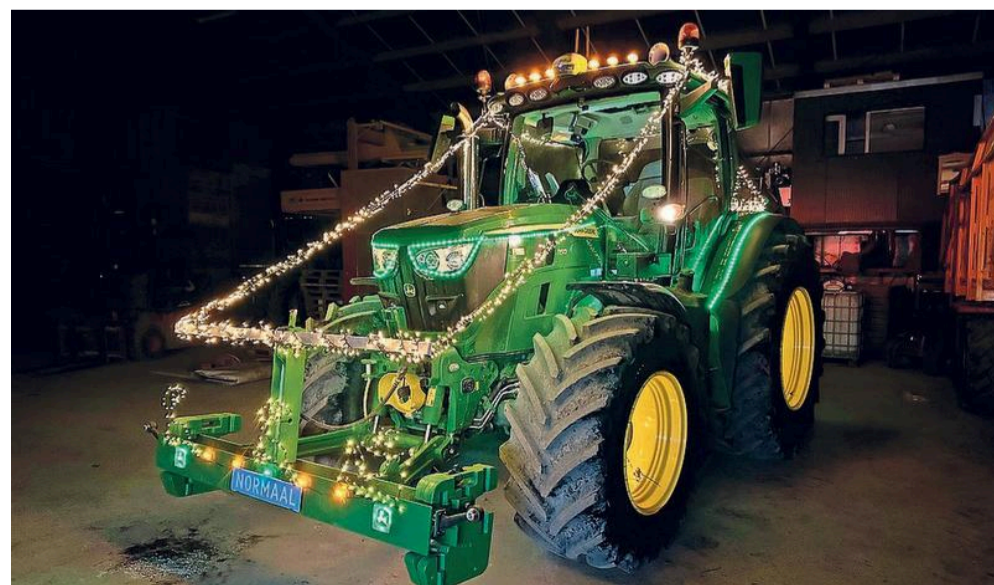
Steven Bruin uit Wieringerwerf is wel vier uur bezig geweest met het versieren.