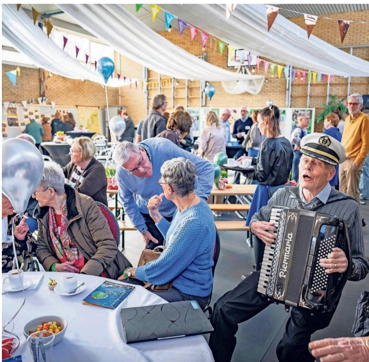
Tussen de gesprekken door is er ook ruimte voor muziek.